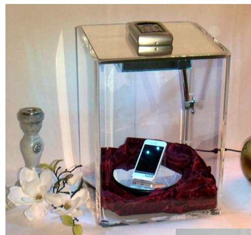
Tresor mit Dekor-Beispiel