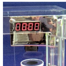
Countdown- Display (über der Tür)