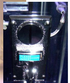
Münzeinwurf (rechte Seite des Tresors)